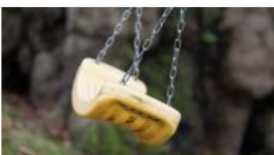
Auch mal schaukeln im Garten...