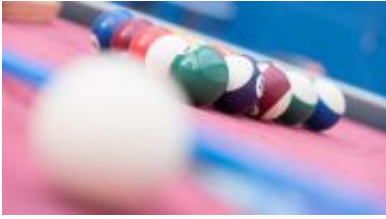
Freizeitgestaltung zum Beispiel mit Billard