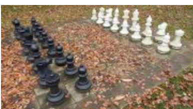
Schachfiguren im Garten