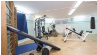
Sport und Fitness auch in der Freizeit