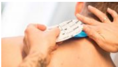
Akupunktur, Qi Gong, Schwimmen...