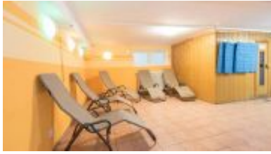
Saunen und entspannen